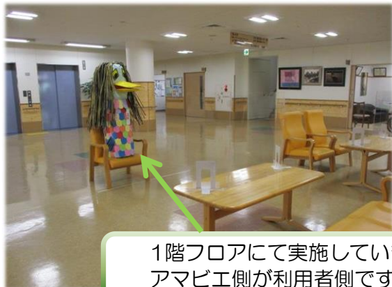
1階フロアにて実施しています。 アマビエ側が利用者側です。

いつも大変お世話になっております。 コロナウイルス感染対策の一環として、ご家族様の面会を制限させていただいておりました。 ご利用者様、ご家族様がずっとお会いできない状況が続きご心配をおかけし、大変に申し訳ありませんでした。今年の夏より試験的ではありましたが対面での面会を開始しました。緊急事態宣言や感染者数の増加等により一時的に面会の中止をさせていただいた期間もありましたが、皆様のご協力のもと今まで対面での面会を継続しております。