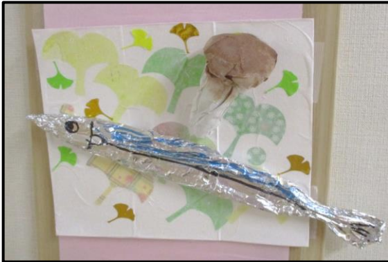
居室前の飾り「さんまとまつたけ」