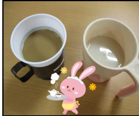
喫茶「コーヒーと甘酒」