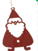
3Fのクリスマス飾り